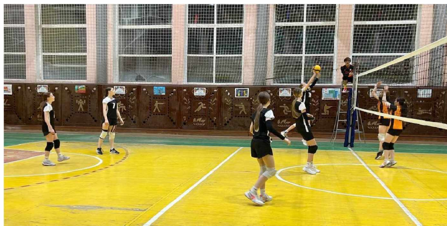
Игровой момент - женские команды Ягодное - Сусуман

Отдел физической культуры спорта и туризма администрации Ягоднинского муниципального округа.