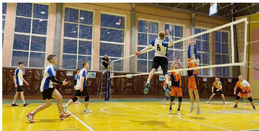
Игровой момент - мужские команды Ягодное - Сусуман